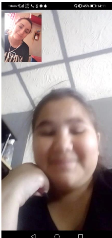
Pružanje on-line podrške u učenju

pojedinačnih koraka i objašnjavanjem svakog zadatka korak po korak. Ako dete ima tehničke probleme da pošalje domaći zadatak nastavniku, volonter bi to uradio umesto deteta.