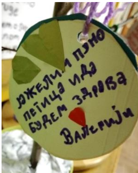
Detalj sa „Drveta želja“

Deca su uglavnom, na početku, priželjkivala materijalne stvari: da dobiju mobilne telefone sa većim brojem kamera, lutke, bicikle... Ovo je bila odlična prilika za razgovor o tome da li nas materijalne stvari čine istinski srećnim, kao i šta je to što ćemo zauvek imati – a to je znanje i iskustvo. Deca su odlično razumela poentu, pa su se zatim mogle čuti i želje da odu u Nemačku ili Francusku, da nauče neki strani jezik, da oni i porodica budu živi i zdravi, da niko koga oni vole ne bude tužan ili da imaju dobre ocene u školi.