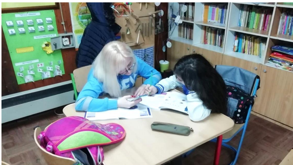
Pružanje individualizovane podrške u učenju

ono što umeju i mogu. Kada naiđu na prepreku, potrebno je da im pružimo podstrek i ohrabrivanje, stavljajući im do znanja da su greške sastavni deo procesa učenja i da one nisu konačni rezultat koji je nemoguće promeniti. Takođe je bilo važno dati im vremena da steknu uvid u svoj rad, svoje postupke, a i vremena da se bore sa preprekama dok ne uspeju da ih prevaziđu.