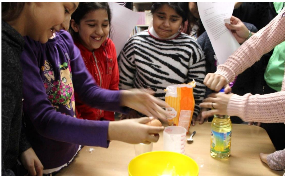
Timski rad na radionici „Takmičarsko kuvanje“

Deca su ozbiljno shvatila takmičenje. Želja za pobedom navela ih je na dobru organizaciju. Prvo su međusobno podelili zadatke: ko čita recept, ko meri količine sastojaka, ko meša sastojke, ko filuje palačinke, dok su bombice pravili svi, kako bi bili brži u spremanju. Svako iz grupe je imao svoje zaduženje koje je obavljao samostalno ili uz pomoć volontera. Iako je u ovoj radionici učestvovao veći broj devojčica, i dečaci su želeli da se oprobaju u spremanju i tako nauče nešto što će im kasnije koristiti. Tokom takmičenja bilo je i želja da se radi samostalno, ali su deca ipak shvatila da je to timska igra. U toku procesa spremanja, sa decom se, osim kulinarskih veština, vežbalo i čitanje sa razumevanjem i praćenje uputstva; pretvaranje mernih jedinica; govorilo se o bezbednom rukovanju kuhinjskim aparatima (mikser, šporet), kao i o korišćenju čaše ili kašike kao mere za određene sastojke ukoliko ne poseduju mericu ili vagicu. Takođe, kroz ovu radionicu deca su se učila i osamostaljivanju, jer je svako dobio priliku da preuzme deo odgovornosti za uspeh tima i proba se u delu spravljanja poslastica.