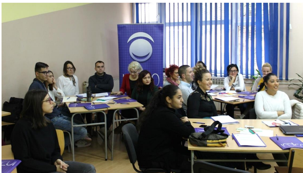
Seminar „Nastavnici kao nosioci kvalitetnog obrazovanja za svu decu“

U OŠ „Sreten Mladenović Mika“, 16. i 17. novembra 2019. godine, organizovali smo dvodnevni seminar „ Nastavnici kao nosioci kvalitetnog obrazovanja za svu decu “, koji je akreditovan odlukom Ministra prosvete broj 611-00-00525/2017-03. Seminar je pohađalo 13 studenata-volontera, 13 nastavnika i 5 saradnika Indiga. Svi učesnici dobili su sertifikat. Cilj seminara je bio da se stvori zajedničko razumevanje o viziji, teoriji i konceptu inkluzivnog obrazovanja, kao i o zajedničkom radu na njegovoj implementaciji na nacionalnom, školskom i odeljenskom/grupnom nivou. Ovaj seminar je bio i prilika da se volonteri i nastavnici bolje upoznaju i započnu komunikaciju i razmenu o podršci koju pružaju učenicima koji su uključeni u projekat.