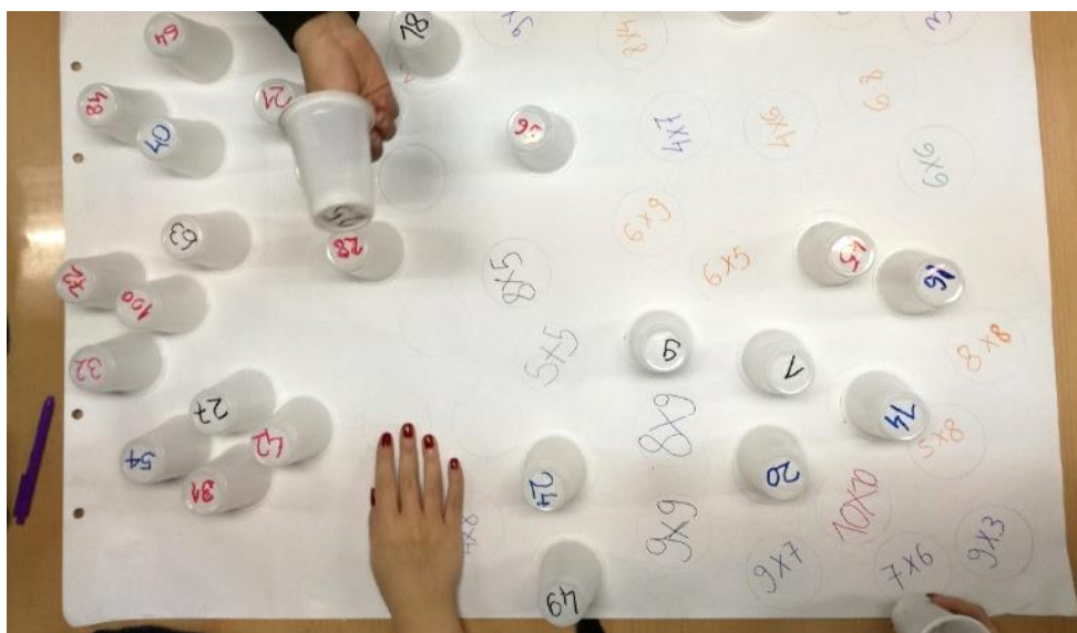
Igra množenja uz pomoć čaša

dnevni život, ali i za nastavak školovanja. Objasnjavali su deci da će im bez toga biti mnogo teže da samostalno urade mnoge zadatke, ali i koliko im je to značajno u svakodnevnom životu izvan škole. Svako dete je dobilo odštampane tablice množenja uz insistiranje da uče kod kuće koliko mogu. Svako slobodno vreme nakon završenih zadataka korišćeno je za proveru onog što su deca naučila. Organizovana su i takmičenja. Svako dete koje je pokazivalo znanje i napredak u odnosu na prethodni put dobijalo je nagradu u vidu pohvale, igračke, narukvice, knjige... To ih je motivisalo da brže napreduju. Sama deca su izrazila želju da naprave pano sa tablicom množenja, koji će ona sama kreirati i postaviti u Društvenom centru. Ponosno smo prihvatili njihovu ideju. Pano je kreiran za jedan dan i svi su nakon toga mogli da koriste tablicu množenja po potrebi. Mlađa deca su bila zahvalna, a ona starija ponosna na sebe. Na delu se videla samoinicijativa povezana sa samopouzdanjem, motivacija povezana sa kompetetnošću i u tom trenutku je bilo jasno da je načinjen značajan napredak u radu, učenju i osamostaljivanju dece.