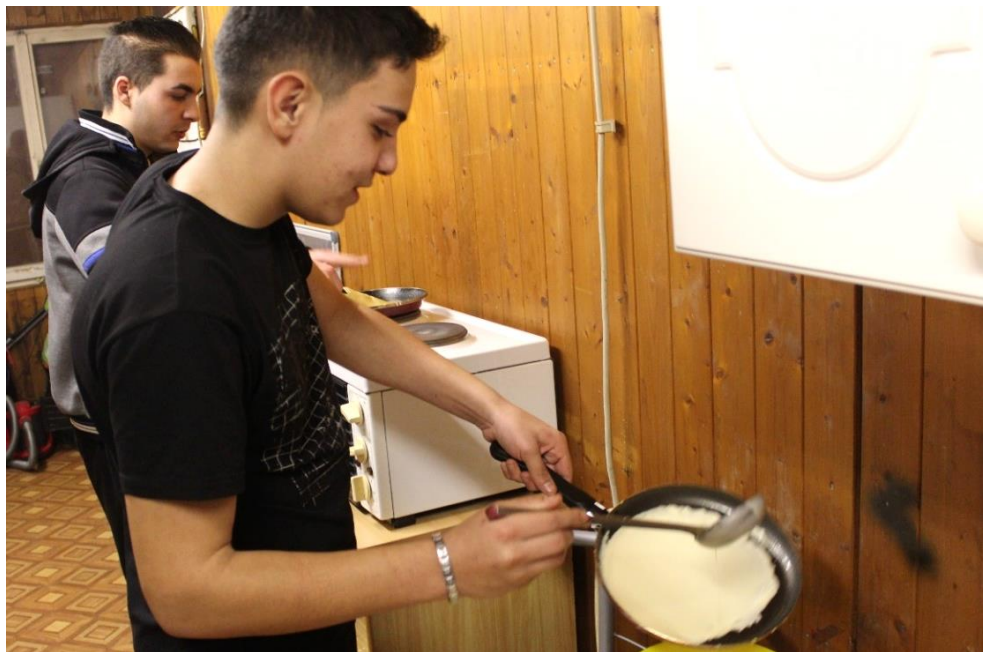
Stariji vršnjaci peku palačinke na radionici „Takmičarsko kuvanje“

istovremeno i podělili svoje iskustvo iz škole, jer se školuju za zanimanje Poslastičar. Oni su pekli palačinke, uz objašnjenje i demonstraciju celog procesa, uključujući i okretanje palačinki „u vazduhu“. Deca su ih zadivljeno posmatrala i slušala.