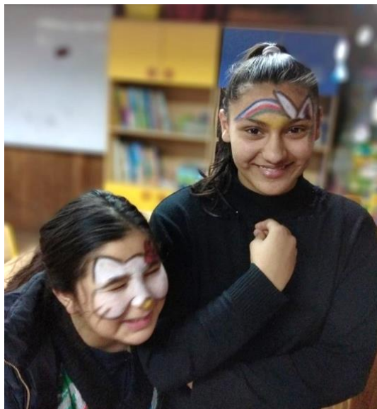
Rezultati radionice oslikavanja lica

razgovor u kome su govorili o tome zašto je izbor pao baš na tu masku; zašto žele da budu baš taj lik/osoba/životinja; koje su pozitivne osobine