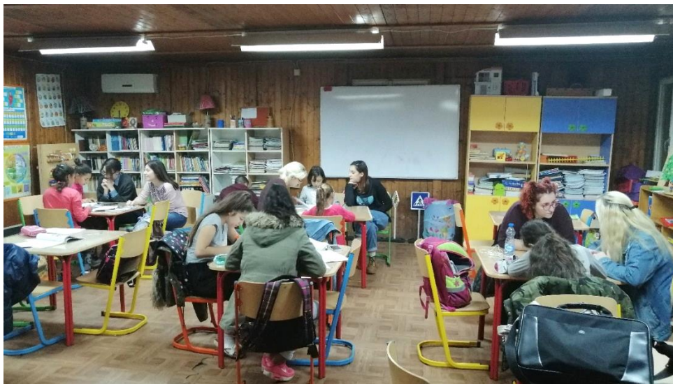
Pružanje pomoći u učenju u Društvenom centru

Takođe, sve vreme prati motivaciju i angažman volontera i nastoji da ih poboljša i unapredi, vodeći ove mlade ljude ka planiranom ishodu – sticanju i unapređenju kompetencija za rad sa decom iz marginalizovanih grupa.